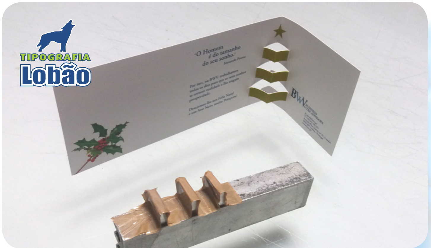
La tarjeta mencionada y el molde inventado